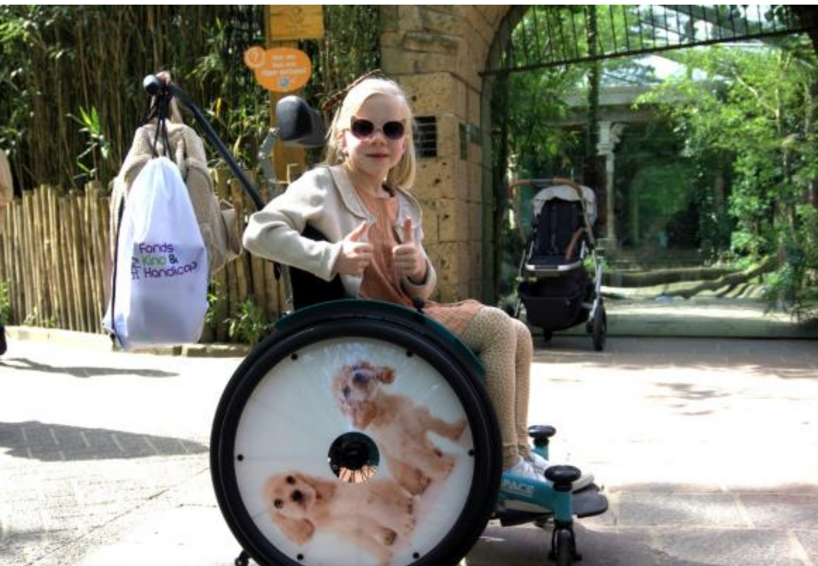
Dierentuindag Fonds Kind & Handicap

Stichting Fonds Kind & Handicap Treilerdwarweg 91 2583 DA Den Haag Telefoon 070 3512784 info@fondskinderhandicap.nl