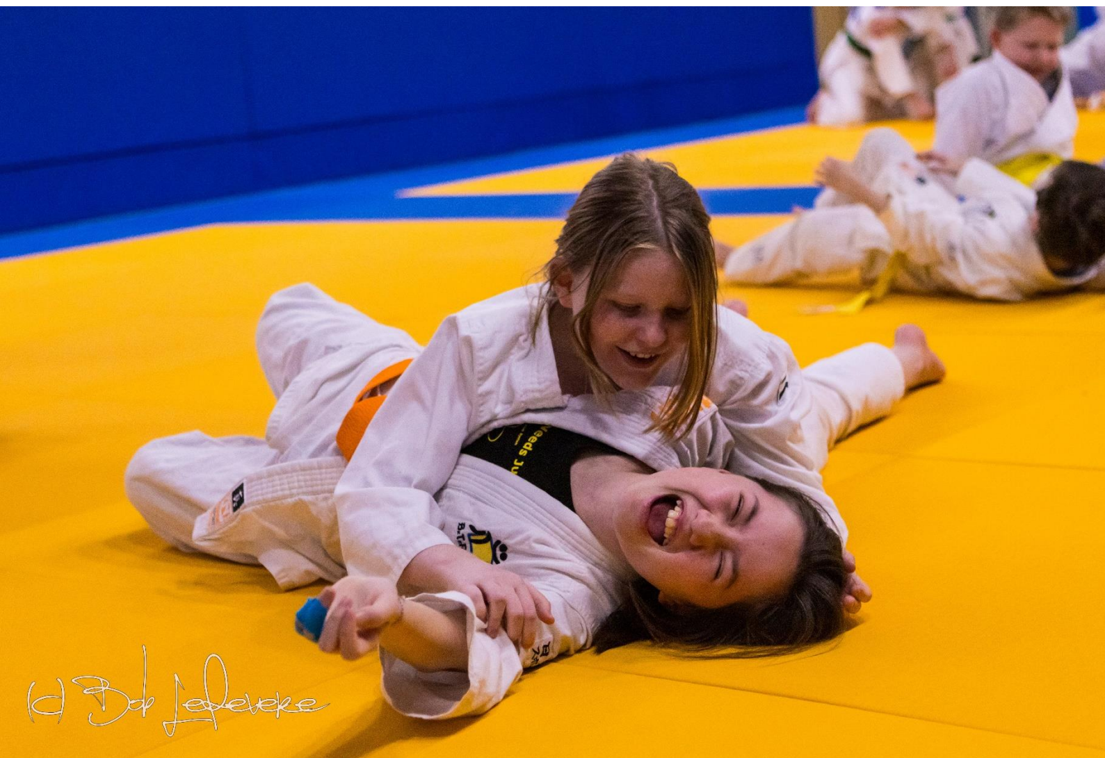
Speciale judomat en wandbescherming voor Special Needs Judo