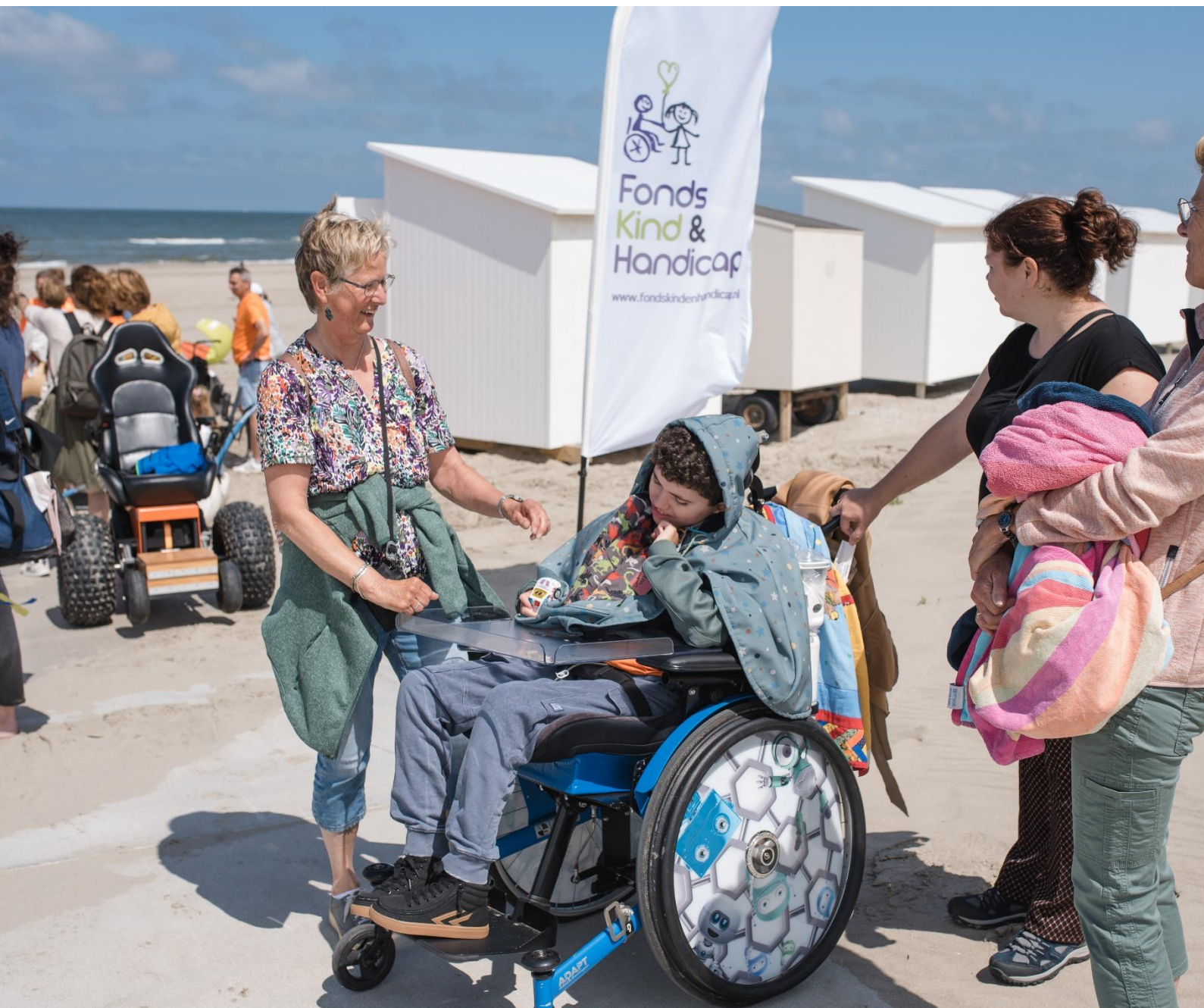
Stranddag Fonds Kind & Handicap