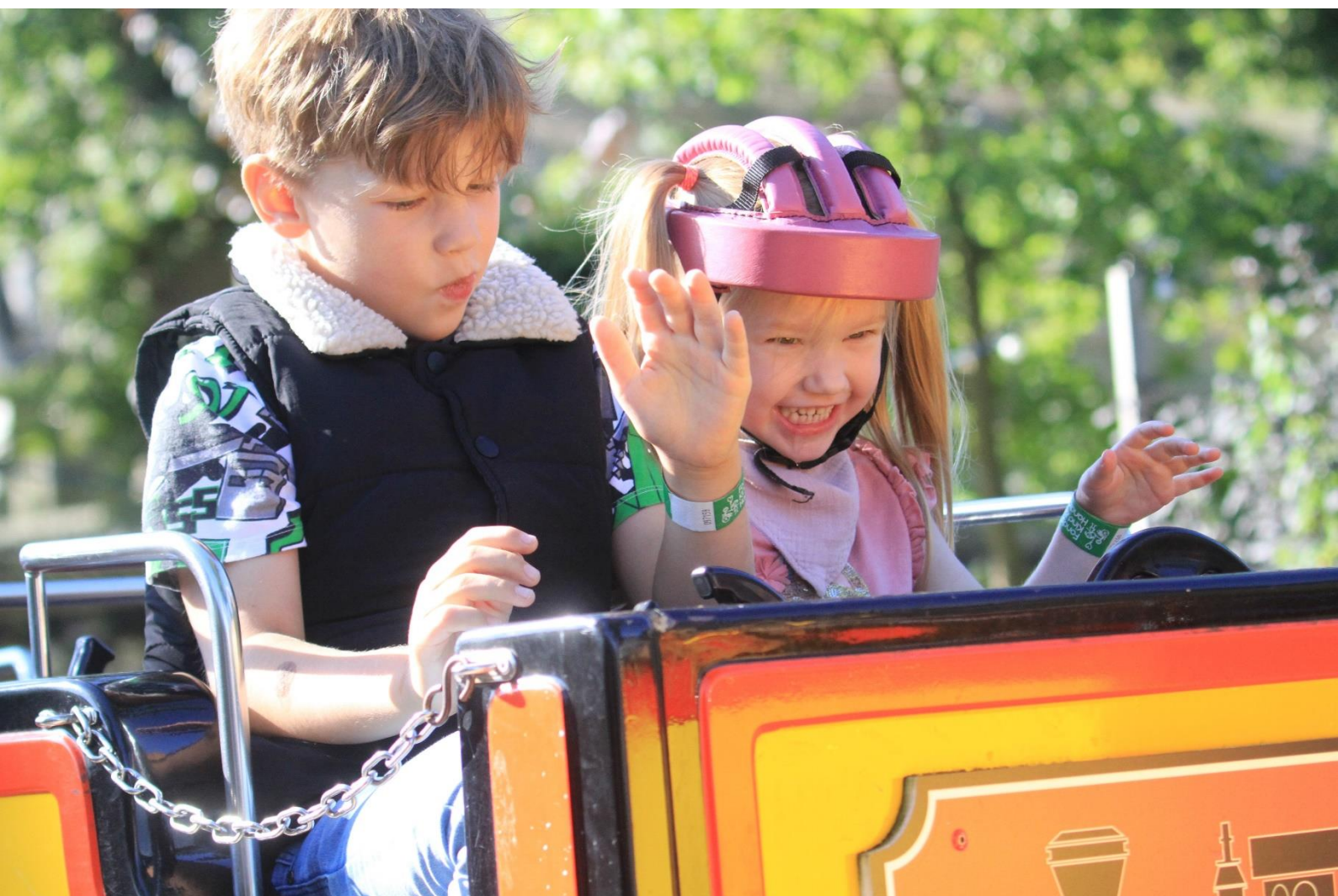
Familie-/lotgenotendag Fonds Kind & Handicap

Daar waar overheden en/of instanties de noodzakelijke hulp niet of niet voldoende kunnen bieden, zal Fonds Kind & Handicap (projecten ten behoeve van) de betreffende kinderen en jongeren trachten te ondersteunen.